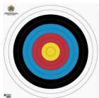
Le tir Fita (tir à 70 m)

Discipline purement française, il est calqué sur le FITA 2x70m et se tire uniquement en deux séries de 36 flèches à 50 mètres sur blasons de 122 centimètres.