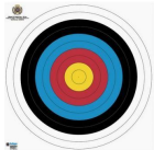
Le tir Fédéral (tir à 50 m)

Discipline purement française, il est calqué sur le FITA 2x70m et se tire uniquement en deux séries de 36 flèches à 50 mètres sur blasons de 122 centimètres.