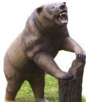
Le tir 3D

Le tir nature est un parcours de 21 cibles placées à distances variables (5 à 40m) qui se pratique en pleine nature. Les cibles sont des images animalières comportant une zone tuée et une zone blessée.