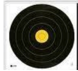
Le tir campagne

Discipline internationale, qui se pratique en terrain accidenté à découvert ou en sous-bois, sur un parcours de 24 cibles dont les distances sont soit :