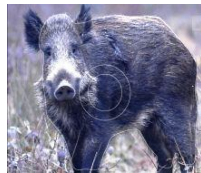
Le tir nature

Le tir nature est un parcours de 21 cibles placées à distances variables (5 à 40m) qui se pratique en pleine nature. Les cibles sont des images animalières comportant une zone tuée et une zone blessée.